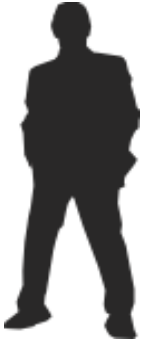
Иллюстрация к портрету среднего белорусского блоггера.

Портрет среднего белорусского блоггера: это мужчина из Минска, 25 лет, с высшим образованием. Этот блоггер ведет два блога: один – в ЖЖ (LiveJournal), второй либо автономный, либо на блогплатформе – в любом случае он использует Wordpress. Причем автономный блог расположен в доменной зоне .com.